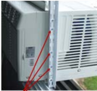
Trous prépercés sur les côtés du climatiseur

6. Solidifier votre installation il est important de fixer, à l'aide d'équerres vissées, le climatiseur dans les montants pour support de tablettes ajustables doubles ainsi que dans la barre de support déjà existante.